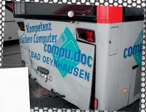
Reparaturen aller Art